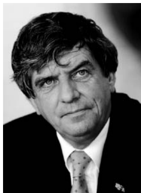
Cees Veerman Minister van Landbouw, Natuur en Voedselkwaliteit

Het ministerie van LNV en PHN willen met deze “Visie op de houtoogst” de aandacht voor houtproductie vergroten in beleid en beheer. Deze visie is de basis voor gezamenlijke activiteiten van de overheid en bos- en houtbedrijfsleven om duurzaam gebruik van onze bossen te stimuleren.